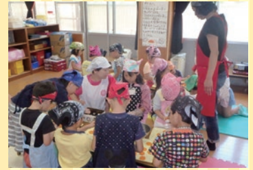
藤の木子どもキッチン 小学生が地域の方々といっしょに料理を作って楽しむ取組。みんなで協力して作り、いっしょに食べる料理は格別です!!

児童館は、18歳未満の子どもたちとその保護者が自由に利用できる施設です。子どもたちが安心、安全に過ごせる居場所を提供するとともに、「あそび」を通して、子どもたちの社会性を育み自立を支援することが児童館職員（児童厚生員）の役割です。また、児童館は、地域の子育て支援の拠点として、様々な取組を行っています。さらには、昼間留守になる家庭の子どもたちが安心して放課後を過ごすための「学童クラブ事業」も行っています。