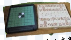
オセロ・しょうぎ