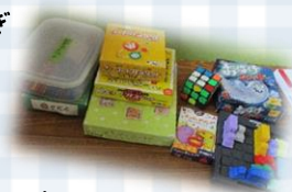
カートゲームなど